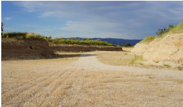
EXEMPLE DE RESTAURACIÓ PENDENT

El sòl no urbanitzable del terme municipal de Roquetes, identificat al plànol d'ordenació de la serie N.1.2 del P.G.O.U. CLASSIFICACIÓ DEL SÒL I USOS GLOBALS (SNU). Claus 13 i 12 a .