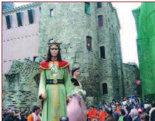
ELS GEGANTS DURANT EL RECORREGUT DE LA CERCAVILA PELS CARRERS DE BARCELONA. A BAIX, ELS GEGANTS DEL PI I DE ROQUETES AMB LES SEVES CORRESPONENTS COLLES.

La plantada va començar al matí, a la plaça de Sant Josep Oriol, al barri del Pi. I, per agafar forces, va haver-hi esmorzar per a totes les colles geganteres participants, que van ser, entre d'altres, el Lleó i la Mulassa de Barcelona, el gegantó Perot lo Lladre, els gegantons del Pi, els gegants del Pi, de la Plaça Nova, del Raval, Barceloneta, Ciutat Vella, colles d'altres districtes de Barcelona i també d'altres poblacions de Catalunya, entre les quals hi havia la de Roquetes. Cap a les 11 hores, la comitiva gegantera va començar la desfilada, just en acabar-se l'actuació dels Falcons de Barcelona. Van recórrer els carrers del Cardinal Casañas, les Rambles, Ferran, plaça de Sant Jaume,