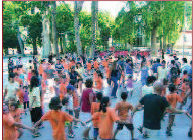
L'ACTE DE CLOENDA DE L'ESPLAI D'ESTIU VA OBRIR ELS ACTES DEL TRADICIONÀRIUS. A BAIX, L'HORTET DEL CANT, LA NIT DE DIVENDRES.