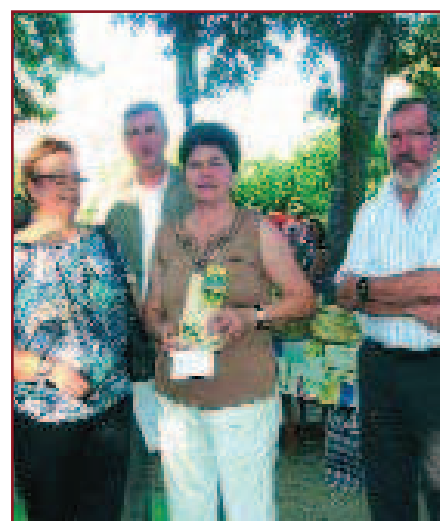
IMATGES DE LA FIRA D'ARTESANIA I MOSTRA D'OFICIS, DE LA TROBADA DE PUNTAIRES I DE L'ENTREGA DE PREMIS DEL CONCURS DE PUNYETES, AIXÍ COM LES OBRES PREMIADES.