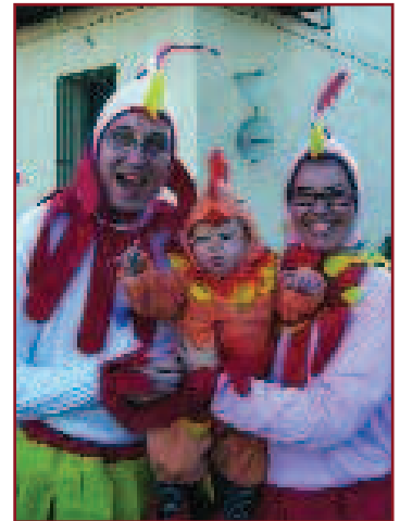
A LA RAVELETA, EL CARNESTOLTES ES VA CELEBRAR LA SETMANA SEGÜENT. PARTICIPANTS I PÚBLIC VAN GAUDIR D'UNA RUA QUE VA RECÓRRER ELS PRINCIPALS CARRERS I VA ACABAR AL CASAL DE LA RAVAL DE CRISTO.