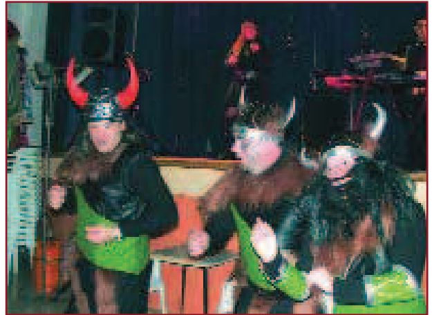
LA IMATGE DE DALT CORRESPON AL BALL DE CARNAVAL QUE VA TENIR LLOC A LA LIRA; COM PODEU VEURE, UN BALL ENVAÏT PELS VIKINGS.