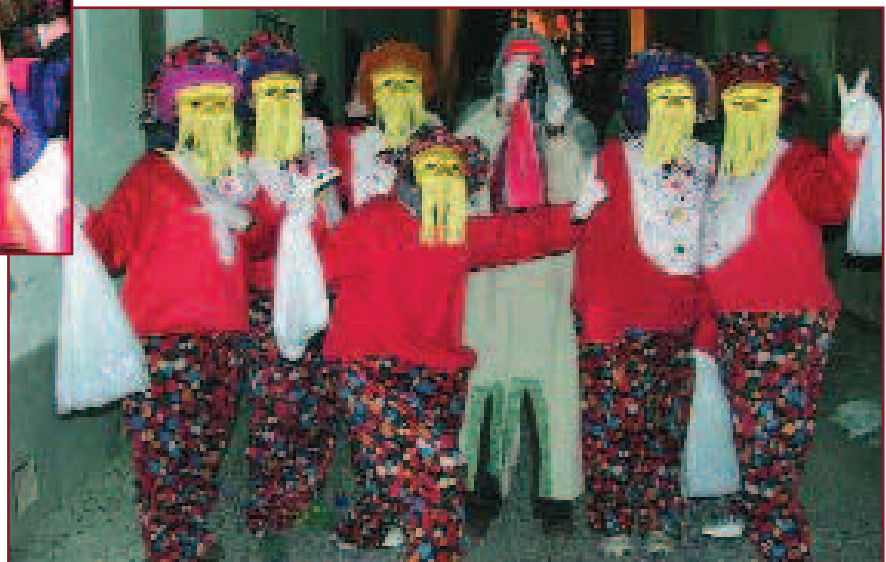
LA CARROSSA DEL REI CARNESTOLTES VA DESFILAR PEL CARRER MAJOR DE LA CIUTAT, PROCEDENT DE LA PLAÇA DE LA RAVAL NOVA. ACOMPANYANT-LA, UN PÚBLIC AMB MOLTES GANES DE PASSAR-HO BÉ, TOT I EL FRED D'AQUELLA TARDA. MÀSCARES, PLOMES, BARRETS, DISFRESSES MULTICOLOR EN UNA RUA FORÇA PARTICIPATIVA.