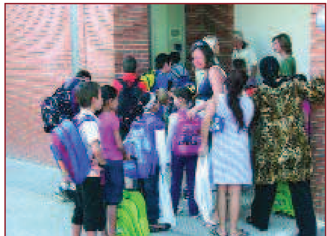
ELS ALUMNES DE L'ESCOLA RAVAL DE CRISTO EN EL SEU PRIMER DIA DEL NOU CURS ESCOLAR.