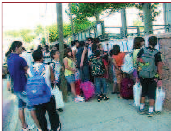
IMATGES DEL PRIMER DIA DEL CURS 2010-2011 A L'ESCOLA M. M. DOMINGO.

624 alumnes matriculats i manté el mateix nombre de docents dels darrers cursos. Igual que en el curs anterior, el centre compta amb tres línies per curs, amb una mitjana de