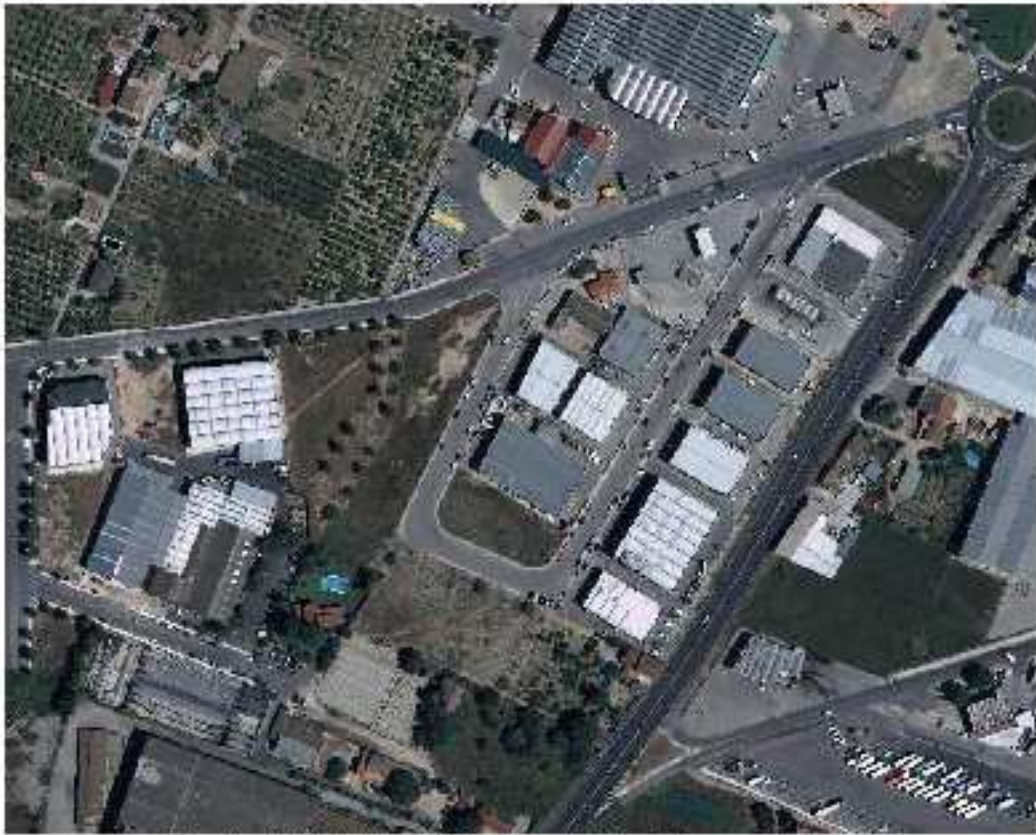
Sector "Antic Hort d'En Gas" Max. Ocupacio: 50%

— Superposició del límit del sector l'Antic Hort d'en Gas