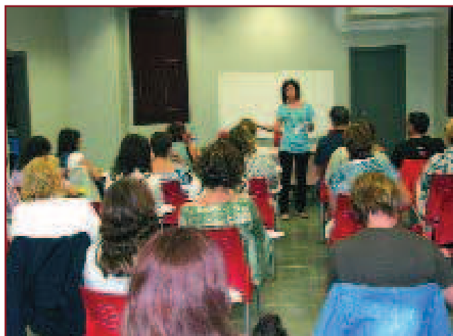
IMATGE D'UN DELS CURSOS DE CATALÀ QUE VA TENIR LLOC EL NOVEMBRE PASSAT AL CASAL DE JOVES.

Un d'aquests serveis és el que ofereix a Roquetes el mateix Ajuntament a través d'una formació continuada que és impartida al casal de joves. Una programació de cursos estable perquè tothom qui ho desitgi pugui ampliar els seus coneixements i pugui optar així a possibles llocs de treball diferents als què havien exercit fins ara. A tall d'exemple, cal citar els cursos que estan apunt d'iniciar-se a hores d'ara al casal, adreçats a treballadors de règim general, autònoms i personal laboral, que estan organitzats per l'Idfo-UGT (que els subvenciona al cent per cent)