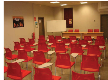
Sala de formació/xerrades