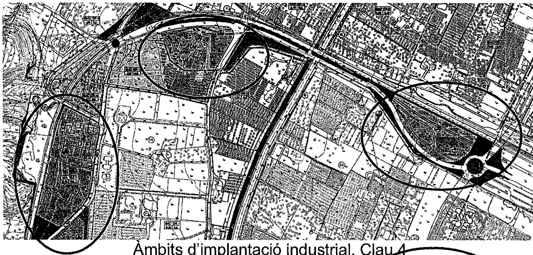
Ambits d'implantació industrial. Clau 4