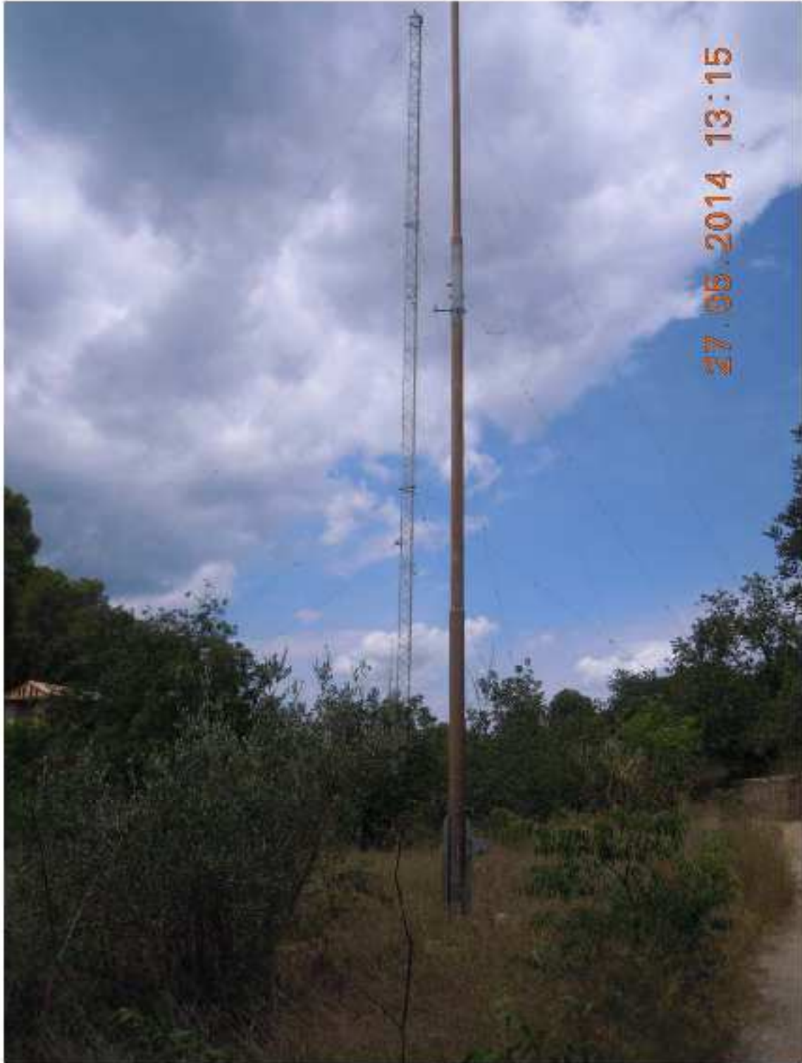
Torre per suport d'antenes en desús